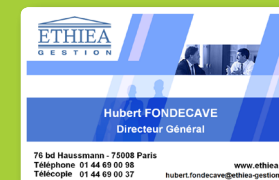
Cartes de visite