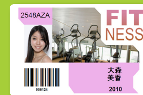
Cartes de membres